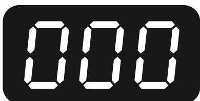
Pohotovostní režim nabíječky

F07 Výstup alternátoru je mimo typický provozní rozsah