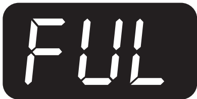
Akumulátor plně nabit