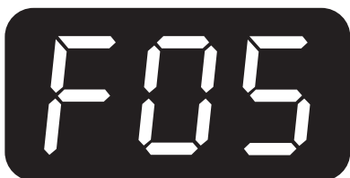
F05 - Přehřátí

Odpojte nabíječku a nechte ji po dobu 30 minut zchladnout, zkontrolujte, zda je ventilace odpovídající