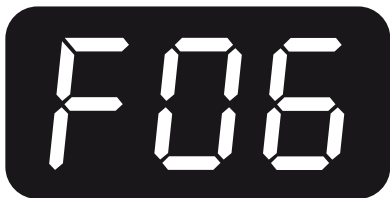
F06 Opačná polarita

Odpojte nabíječku a nechte ji po dobu 30 minut zchladnout, zkontrolujte, zda je ventilace odpovídající